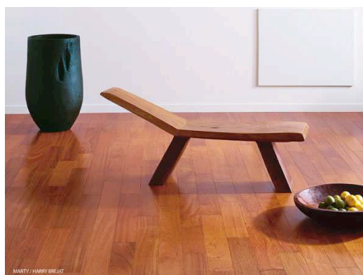
Linéal de Parquets Marty : en lames larges de longueurs et largeurs différentes, ici en Jatoba, largeur 125 mm. (Prix public indicatif : 83 euros TTC/m 2 )