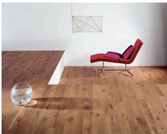
Massif Chalet Chêne Natura 90 mm de Parquets Marty : lames larges et finition patinée pour un parquet à la fois moderne et authentique. (Prix public indicatif : 70 euros TTC/m 2 )

En multilamelles ou lames larges , les parquets Marty offrent de nombreuses possibilités d'associations entre essences, teintes et finitions pour que chacun trouve le parquet à la hauteur de ses rêves, tant par l'aspect pratique que le rendu esthétique.