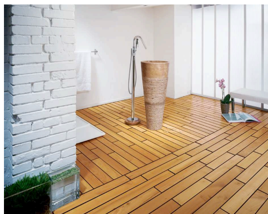
Linéal Marine Acacia de Parquets Marty : l'aspect huilé et naturel de l'Acacia associé au charme incomparable des joints « pont de bateau » ! (Prix public indicatif : 80 euros TTC/m 2 )