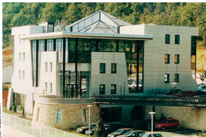
▲ Le siège de Parquets Marty à Cuzorn (47).

Son indépendance retrouvée, cet acteur majeur du marché se présente aujourd'hui comme une entreprise sans dette financière, conformément aux accords finalisés le 3 juillet et validés par le Tribunal de commerce d'Agen, visant à sécuriser l'avenir de Parquets Marty. En effet, le plan d'investissement de 3,8 M€ sur 3 ans sera entièrement autofinancé et le remboursement de la dette liée au redressement judiciaire, à hauteur de 14 M€ sur 10 ans, s'effectuera par :